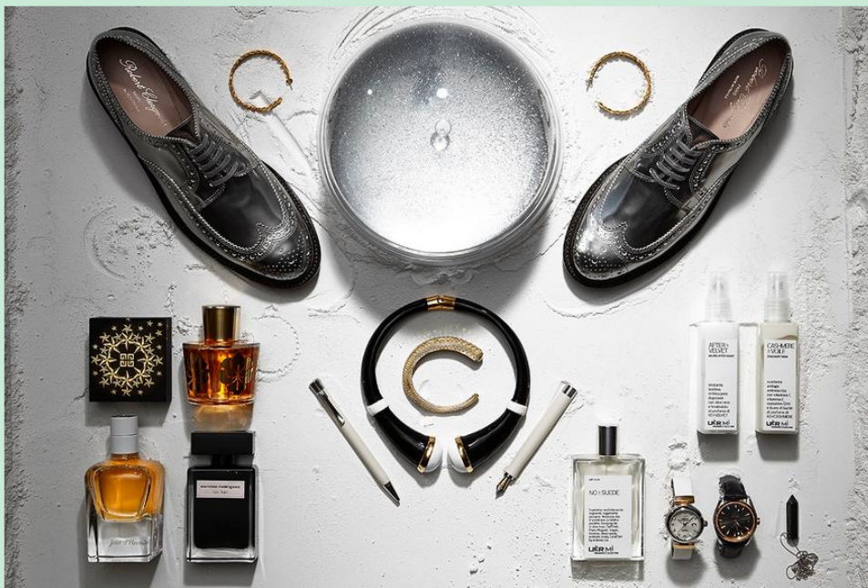
Derbies argentées, Robert Clergerie, 495€ / Boucles d'oreille, Aurélie Biedermann (chez Smets), 395€ / Boule "Silver Glitter" XL ligne « 13 », Maison Martin Margiela (chez Smets), 149€ / Collier, Tom Ford (chez Smets), 490€ / Bracelet, Wouters & Hendrix, 380€ / Stylo bille et à plume blanc, Graf fon Faber, prix sur demande / Palette ombre à paupières Ondulations d'Or, Givenchy, 56€ / Parfum Iris Nobile, Acqua di Parma, 135€ / Jour d'Hermès, Hermès, € / Parfum for Her, Narciso Rodriguez, 65,70€ / Baume after-shave After Velvet, Uèrmi (chez Cachemire & Coton de Soie), 145€ / Crème hydratante Cashmere Voile, Uèrmi (chez Cachemire & Coton de Soie), 145€ / Parfum No Suede+, Uèrmi (chez Cachemire & Coton de Soie), 145€ / Montre femme bracelet blanc, Omega, prix sur demande / Montre homme bracelet noir, Omega, prix sur demande / Collier avec pendentif pierre d'hématite, Ultime (chez Fbr), 30€