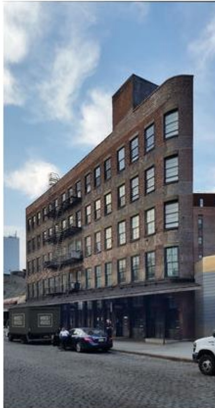
House of Houses à Manhattan