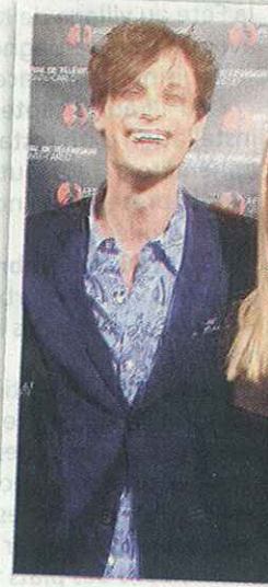
Avec Matthew Gray Gubler, plus drôle que dans Esprits criminels.