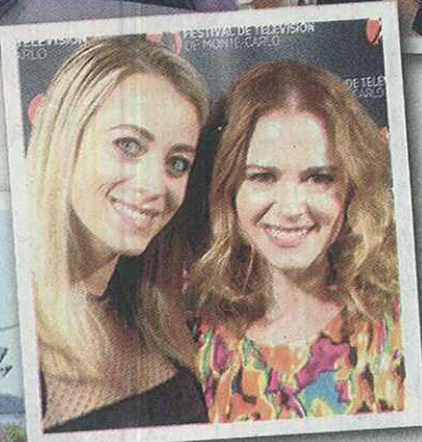
Avec Sarah Drew (April), l'une des héroïnes de Grey's Anatomy.