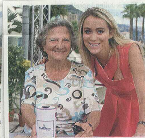
Lee Majors, plutôt charmé par l'animatrice belge qui a passé un agréable moment avec Marthe Villalonga.